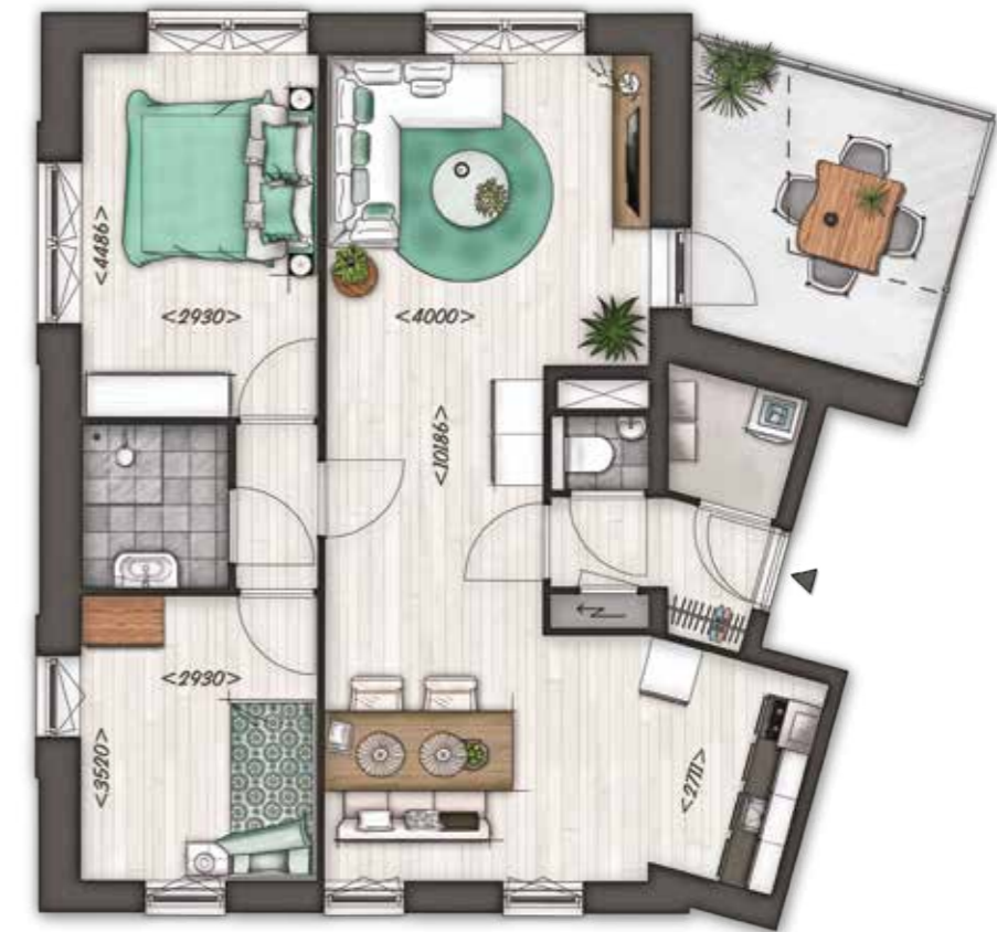
Type H2 - huisnummer 26

In de plattegrond van de wijk zijn ook de huisnummers zichtbaar gemaakt. In deze folder vindt u alleen de plattegrond van woningtype H2. De overige plattegronden vindt u op de website van Dunavie.